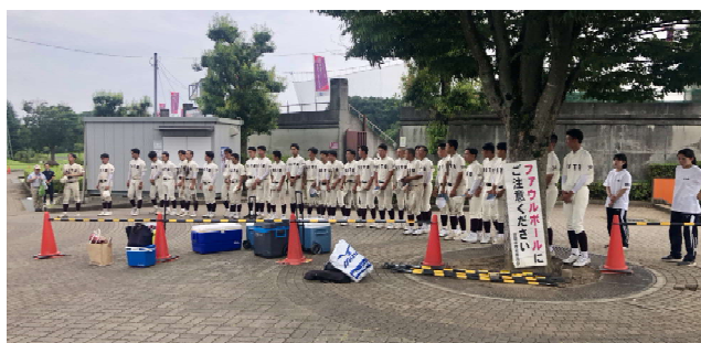
令和6年選手権茨城大会三回戦 令和6年7月17日(水) 笠間市民球場 水戸一●8-15守谷

そろそろ飛田穂洲および石井連藏両大先輩の業績に続く新たな歴史を刻むべき時期に来ている。71年ぶり4回目の甲子園は一大応援団で溢れ、場内には「栄冠は君に輝く」と校歌「旭輝く・・・」が響き渡る。奮い立て！水高健児！