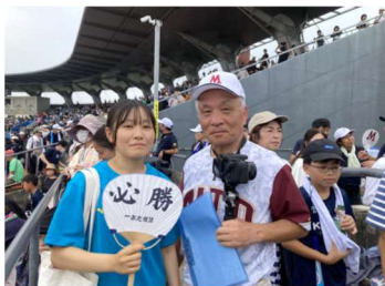
入学した孫娘との応援(令和5年夏)

三の丸倶楽部が創設されて17年が経過した。現幹事6名、元幹事を含めると約15名の協力により、会報年2報発行、用器具寄贈、遠征費支援、コーチ謝礼など具